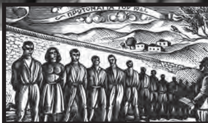
80 χρόνια από την εκτέλεση των 200 αγωνιστών στην Καισαριανή σελ. 5