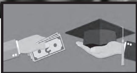
Εθνικό Απολυτήριο, Ιδιωτικά Πανεπιστήμια Σχολεία εξεταστικά κάτεργα , κλειστά για τους φτωχούς μαθητές σελ.3